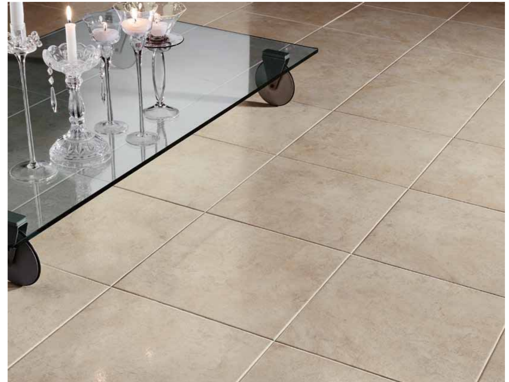
35x35 cm 14"x14" E276 U3 P3 E3 C2